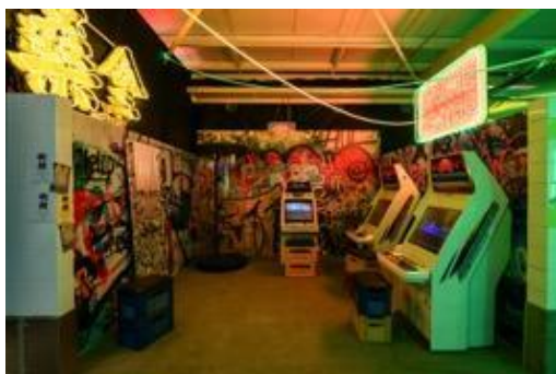
打卡熱點 - 「數碼龐克號」內的遊戲室，街機在未來世界仍然大受歡迎