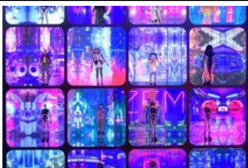
「數碼龐克號」10 款限量版立體人物模型人造人 Zero，穿著 10 組時裝及配飾設計師的服飾