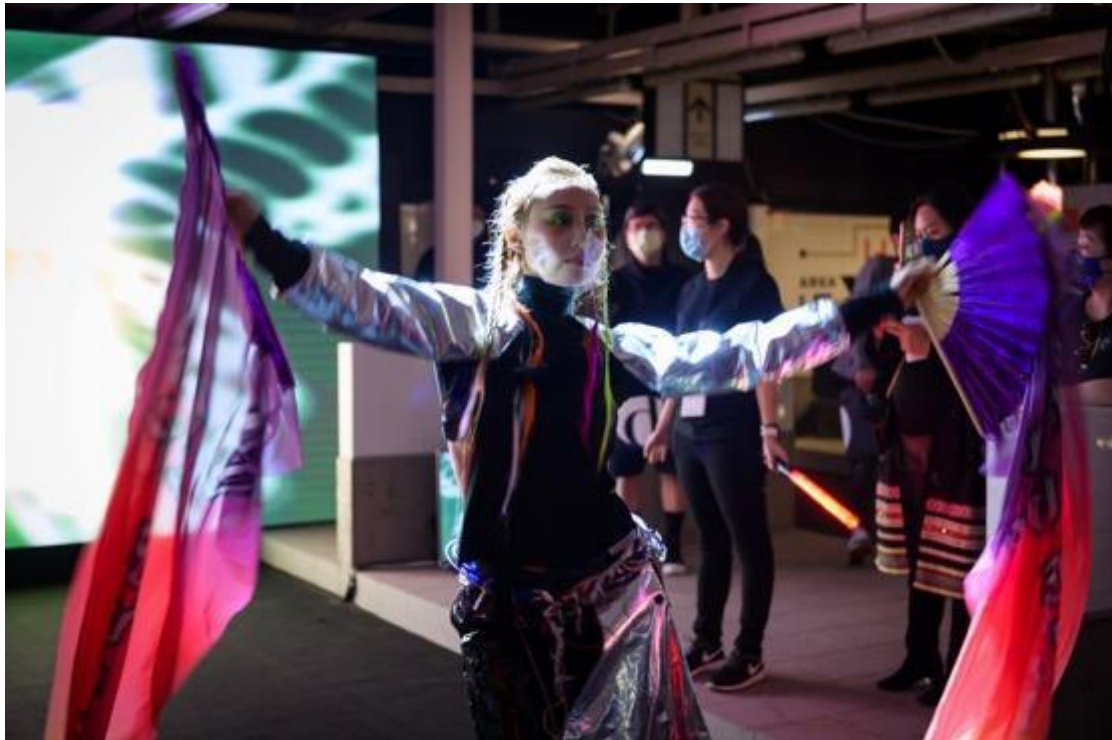
图片说明：创意时尚体验「数码庞克号」主场地

创意时尚体验「数码庞克号」正式启航 亲临深水埗进入超现实科幻世界 体验霓虹灯下的时装幻影