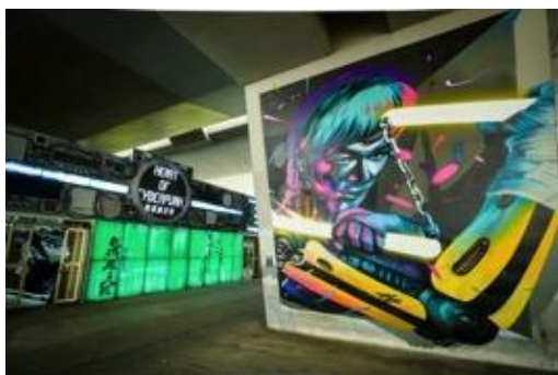
「數碼龐克號」總部入口