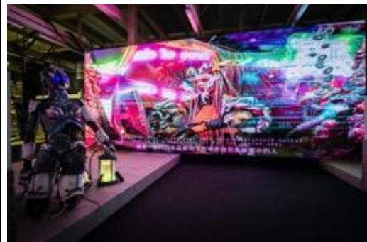
打卡熱點 - 「數碼龐克號」半人半機械的電影場景裝置，位於通州街臨時街市的打卡熱點被超凡生物人工智能載體「Mother Brain」喚醒