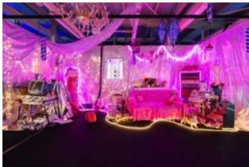
打卡熱點 - 「數碼龐克號」時代既夢幻且科幻的少女房間