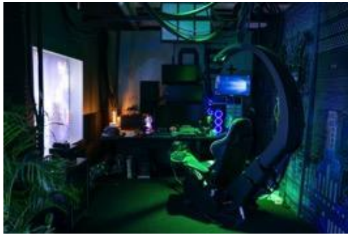
打卡熱點 - 「數碼龐克號」內的科幻工作室，可一窺未來世界黑客宅男眼中所見的影像