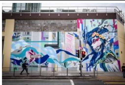
由 HKWALLS 創作「數碼龐克號」大型戶外壁畫- 畫家 TAKA