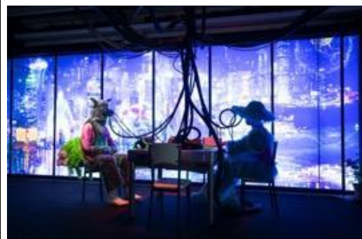
打卡熱點 - 「數碼龐克號」內的「麻雀房」