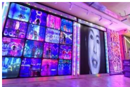
作為「數碼龐克號」的展覽店，「合舍」將變身為機械人改造工場，同場亦將展示 10 款限量版立體人物模型，讓你發現時裝的另一種展現模式